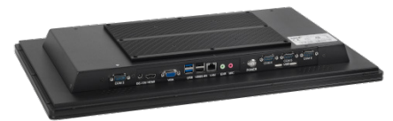
PC INDUSTRIEL PLAT