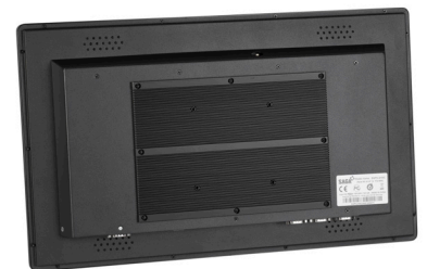
FIXATION MURALE OU SUR MÂT AU FORMAT VESA100