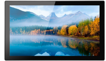
AFFICHAGE DYNAMIQUE OU CAISSE TACTILE?