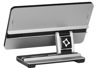
LOGO LCD: CHANGEMENT DE MODE TACTILE