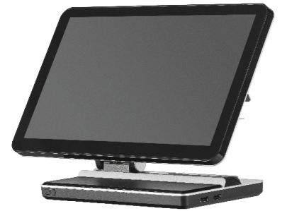
TPV JOA EN ALUMINIUM AVEC ECRAN 16/9