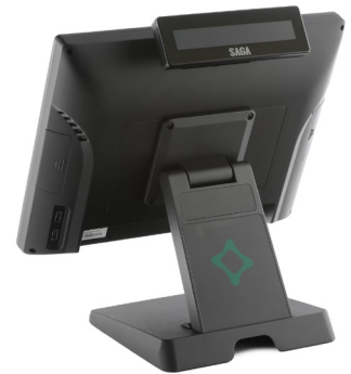
AFFICHEUR 2 LIGNES INTÉGRÉ