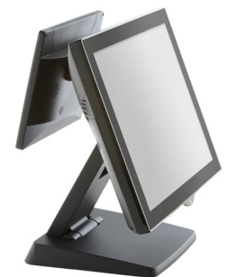
ÉCRAN CLIENT INTÉGRÉ