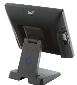
DISQUE SSD RACKABLE